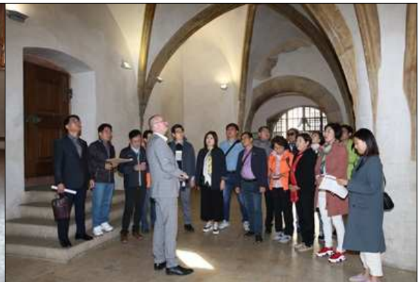
프라하 구시청 면담 2