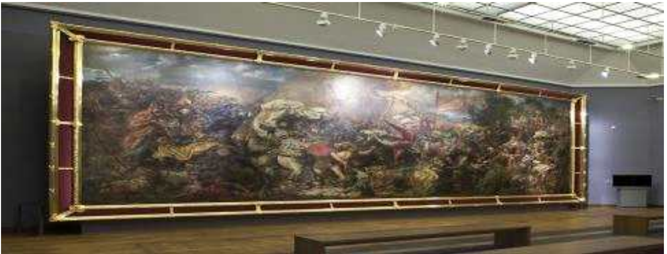
그림 2 폴란드 국립박물관 소장 대형 걸개 그림

대형 걸개(가로 20m × 세로 8m 가량)그림을 보고 당시의 전쟁 참상을 목격하듯 접하면서, 그 그림을 보존하고자 15 등분 하여 각자 보관하고 123년이라는 침략과 지배에서 벗어난 시점에 다시금 합쳐서 현재의 그림으로 재탄생시켰다는 사실과 플젠은 인구 15만명 상당의 도시이지만 도시 전체의 모형 조감도를 미니어처 방식으로 만들어 행정청에서 보관 전시하고 있는 광경을 볼 때 한옥마을을 떠올리며 가슴이 쿵쥔거림을 느낄 수 있었다.