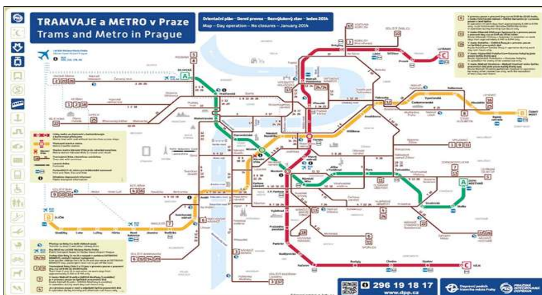
체코 프라하 트램 노선도