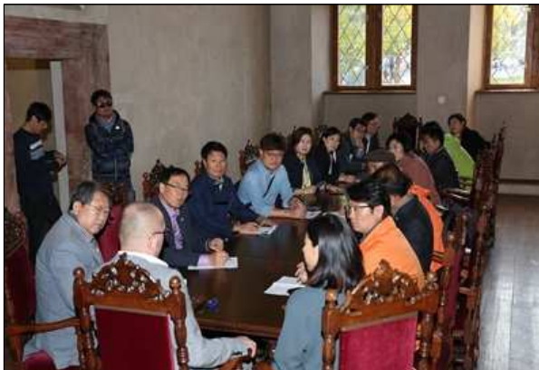
프라하 구시청 면담 1